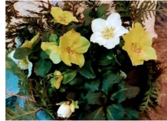
Helleborus in weiß und gelb

Jetzt ist Blütezeit für viele Frühlingsboten . Zahlreich erscheinen nun klassische Frühblüher wie Krokus (Crocus), Christrose (Helleborus niger) oder Narzisse (Narcissus pseudonarcissus).