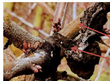
Fruchtmumien an Mirabelle

Oftmals hängen auch jetzt beim Steinobst noch Früchte vom letzten Jahr an den Ästen. Diese müssen ebenfalls entfernt werden, da sie als Fruchtmumien wieder die neuen Blüten und Früchte infizieren können.