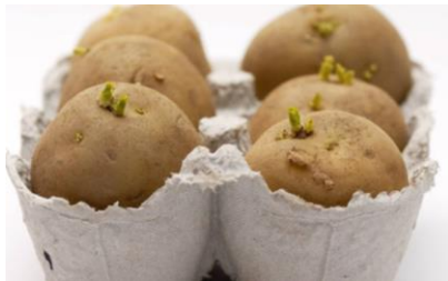
Keimung von Kartoffeln in Eierkartons

Ab Ende März können Frühkartoffeln vorgekeimt werden. Dazu werden die Pflanzkartoffeln nebeneinander in Kisten oder Eierkartons gestellt. Bei einer Temperatur von 12 bis 15 °C an einen hellen Standort keimen die Kartoffeln in etwa vier Wochen.