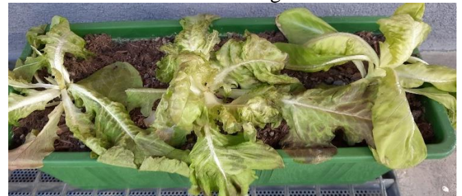
Frostschaden an Salat im Balkonkasten

So können Radieschen, Rettiche gesät, aber auch Salate schon im März ins Freie gepflanzt werden. Je nach Gemüseart beträgt die Verfrühung mit Folie oder Vlies ca. 8 – 10 Tage.