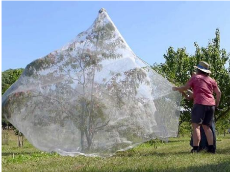
Insektenschutznetz für Obstbäume gegen Pflaumenwickler und Kirschfruchtfliege

Die beste und umweltfreundlichste Möglichkeit , um sein Obst vor tierischen Mitbewohnern wie z. B. der Larven des Pflaumenwicklers und der Kirschfruchtfliege in den Früchten zu schützen, sind Insektenschutznetze .