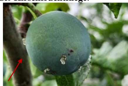
Einstichstellen des Pflaumenwicklers mit Harzfluss

Die Monate Mai und Juni hingegen waren sehr trocken. In den Obstbäumen fühlen sich deshalb die tierischen Schädlinge besonders wohl. Bei genauer Durchsicht unseres Obst- und Gemüsegartens finden wir viele Blattläuse , Pflaumenwickler und im Inneren der Kirschenfrüchte die Maden der Kirschfruchtfliege .