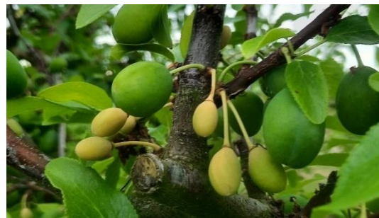
Röteln an Zwetschgen

Die Trockenheit der letzten Monate bekommen jetzt auch unsere Obstbäume zu spüren. Die großen, alten Halb- und Hochstämme in unseren Gärten haben ein umfangreiches Wurzelwerk , welches in der Lage ist, auch in tieferen Bodenschichten noch an Wasser zu kommen. Bei Buschbäumen ist die Lage des Wassermangels sehr viel kritischer. Hier wirkt sich das geringere Wurzelvolumen negativ aus. Die Buschbäume in unseren Gärten sind jetzt dringend auf zusätzliches Wasser angewiesen. Als Faustzahl sind hier 3 - 4 Bewässerungen mit je 10 Liter Wasser pro Woche ratsam.