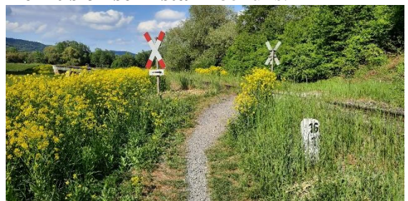
Bild: Orientalische Zackenschötchen

Überall in der Landschaft, vor allem an Wegen und Bahndämmen , sind jetzt halbhohe, gelb blühende Pflanzen zu erkennen, die von weitem an unseren heimischen Raps erinnern. Leider handelt es sich nicht um Raps, sondern um das Orientalische Zackenschötchen , ein invasiver Neophyt . Dieser Kreuzblütler wurde aus Osteuropa und Sibirien eingeschleppt und vermehrt sich sehr stark bei uns.