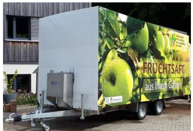
Mobile Mostobstpresse des KV für Gartenbau Forchheim

Somit haben Sie die geniale Möglichkeit, aus dem eigenen Obst köstlichen Saft pressen zu lassen. Die regionale Herkunft ist somit garantiert. Nutzen Sie die einmalige Möglichkeit!!