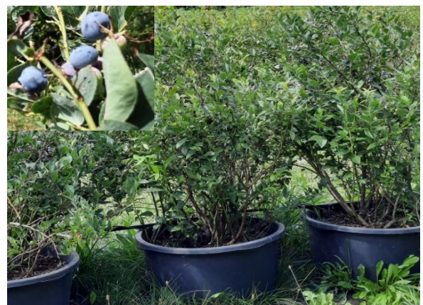
Kulturheidelbeeren im Container

Heidelbeeren in Container können das ganze Jahr gepflanzt werden.