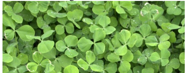
Inkarnatklee ohne Blüte als guter Bodendecker

Im Fachhandel gibt es Saatgut von verschiedenen Gründüngungspflanzen . Als zusätzliche Bienenweide bis zum Frost eignet sich sehr gut die Phacelia . Soll auch über den Winter bis hin zum Frühjahr das Beet eingesät werden, eignet sich Inkarnatklee sehr gut.