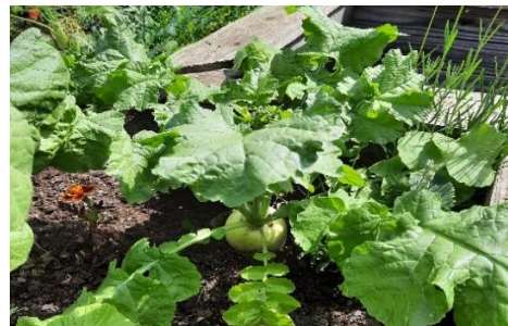
Rettich mit Aussaat Anfang September; Bildaufnahme Mitte Oktober

Bei der Direktsaat wird ein feinkrümmeliges Beet vorbereitet. Bei den verschiedenen Salaten und dem Rettich sollte der Reihenabstand ca. 40 cm betragen. Bei Radieschen und Spinat reichen hingegen 20 – 25 cm aus. Die Aussaattiefe sollte ca. 1 Zentimeter betragen. Nach dem Abdecken des Samens ist das Andrücken und Angießen eine ganz wichtige Maßnahme, damit der Samen gut keimen kann.