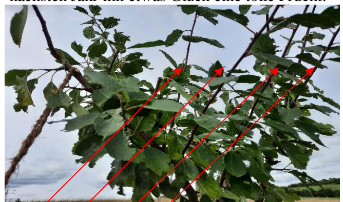
Wasserschosser (1-jähriger, meist senkrechter Trieb) (am 3-jährigen, starkwüchsigen Pflaumenbaum)

Diese Maßnahme funktioniert nur zu diesem Zeitpunkt. An dieser Endknospe entsteht im nächsten Jahr mit etwas Glück eine tolle Frucht.