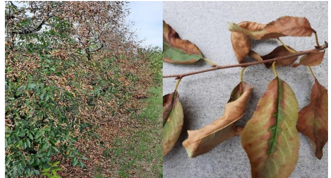
Sauerkirschbaum und -blätter mit starken Trockenschäden

Das sehr trockene Jahr 2025 hat auch deutliche, optische Spuren an unseren Pflanzen hinterlassen. Bei genauer Ansicht, sind an den Blättern von Sträuchern und Bäumen zahlreiche Trockenschäden sichtbar.