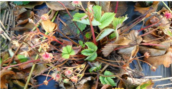
Erdbeerwelke an Ertragspflanzen

Die im August selbst gewonnenen Ableger von Erdbeerpflanzen sind jetzt gut entwickelt und können gepflanzt werden. Alternativ können natürlich auch Jungpflanzen aus dem Fachhandel gepflanzt werden. Ganz wichtig ist es, bei Erdbeeren die Beete regelmäßig zu wechseln. Dabei sollten Erdbeeren nicht länger als drei Jahre auf dem selbem Beet stehen. Ein regelmäßiger ( Beet-) Wechsel mit Gemüse, Kräutern und Gründüngung ist sehr wichtig, damit sich der Pilz der die Erdbeerwelke (Verticillium) verursacht, nicht ungehindert ausbreiten kann.